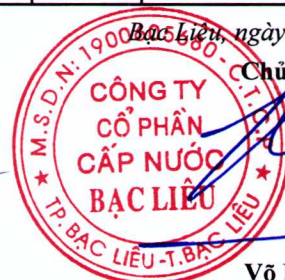
Trần Phước An